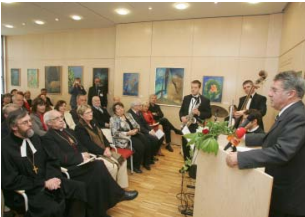
BUNDESPRÄSIDENT DR. FISCHER BEI DER ERÖFFNUNGSREDE

Ein weiteres Ziel der Hilfsgemeinschaft ist es, die zahlreichen noch bestehenden Hürden und Hindernisse zu beseitigen, die blinden und stark sehbehinderten Men-